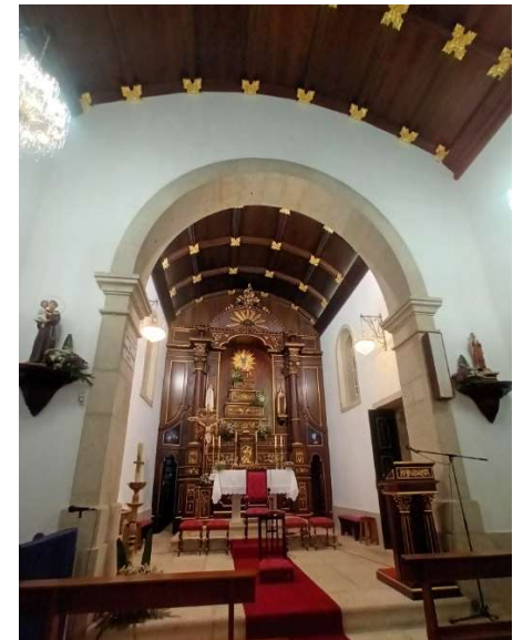
Maître-autel du Sanctuaire

L'intérieur du sanctuaire est une véritable œuvre d'art. Le maître-autel a été sculpté en bois de châtaignier par des maîtres artisans de Porto. On y remarque de grandes colonnes d'inspiration corinthienne encadrant le trône où repose l'image de Notre-Dame de la Santé, une sculpture en argile polychrome du XX e siècle. L'image originale, datant du XVIII e siècle, est conservée dans la Maison de l'Abbé.