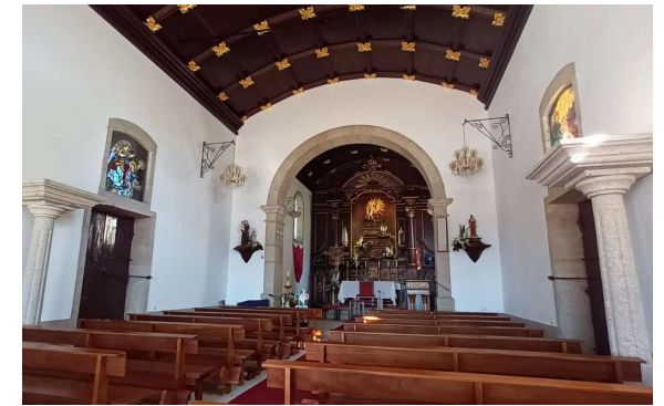
Intérieur du temple