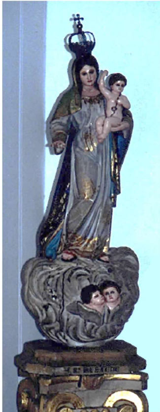
Image primitive de Notre-Dame de la Santé de Longa

Pendant des décennies, les militaires entretenirent la dévotion envers ce saint, finançant les cérémonies grâce à des contributions obligatoires sur leurs salaires.