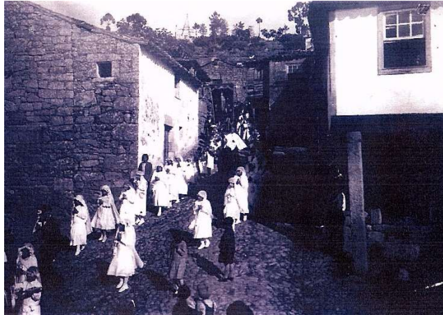
Procession à la fin des années 1920, descente de la Rua da Calçada, avec la construction de la chapelle de Notre-Dame de la Santé en arrière-plan